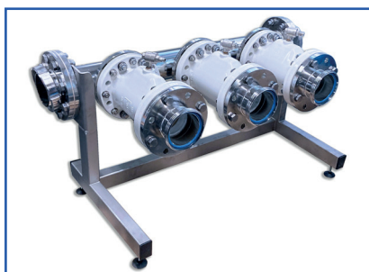
Séparation des moûts avec trois vannes

En cas d'utilisation de l'option de contrôle de la pompe à moût, le jus qui s'est déjà écoulé est pompé dans la dernière fraction exploitée avant la commutation.